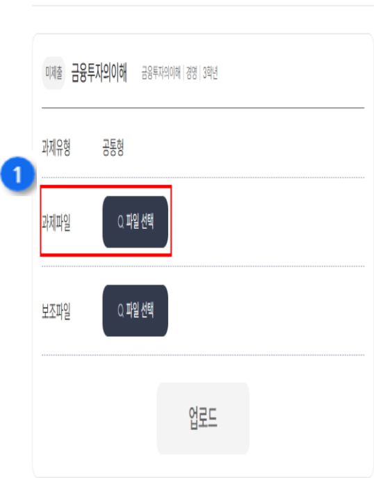
출석수업 과제물 제출